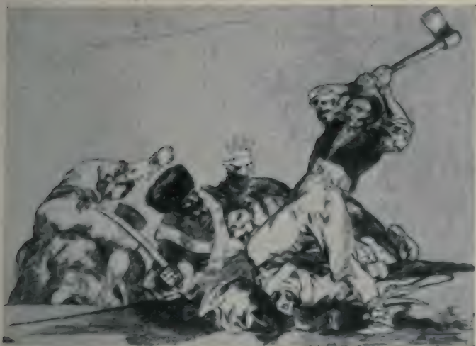
Meurtre d'un Mamelouk.